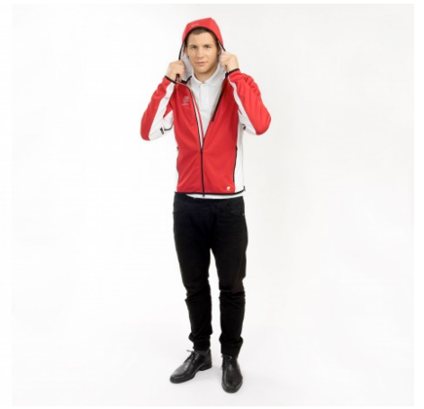
600.93 CHF zzgl. MwSt.