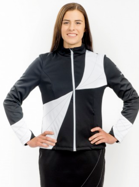
600.93 CHF zzgl. MwSt.