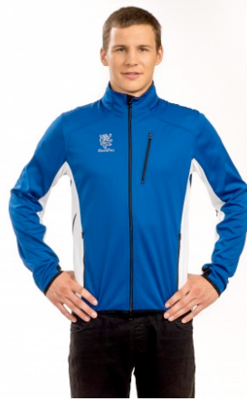
577.99 CHF zzgl. MwSt.