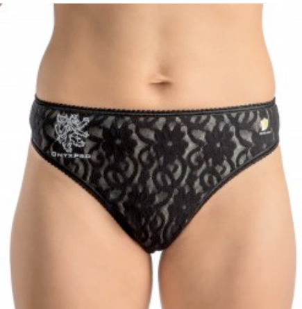
52.01 CHF zzgl. MwSt.