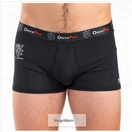
109.26 CHF zzgl. MwSt.