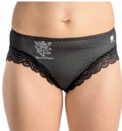
69.49 CHF zzgl. MwSt.