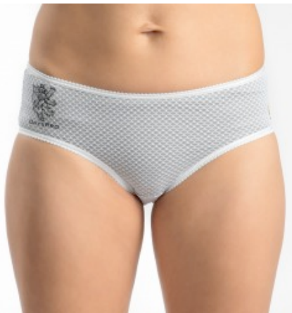
62.28 CHF zzgl. MwSt.