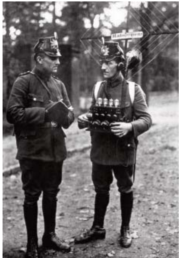
1935: Die Berliner Schutzpolizei experimentiert mit dem mobilen Sprechfunk.

Solange diese Technologie angewandt wird, müssen Schutzwerte gefordert werden, die am Stand der medizinischen Erkenntnis orientiert sind. Varga schlägt einen Weg vor.